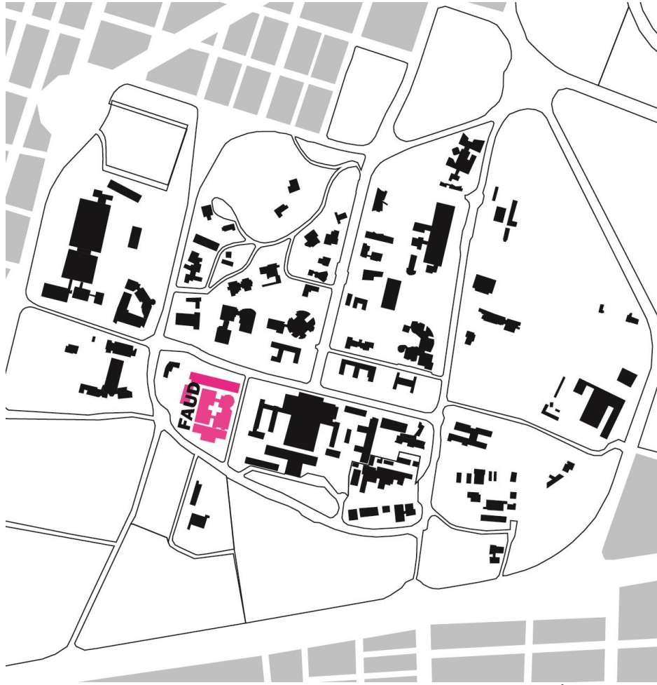
MAPA CIUDAD UNIVERSITARIA - UNIVERSIDAD NACIONAL DE CÓRDOBA